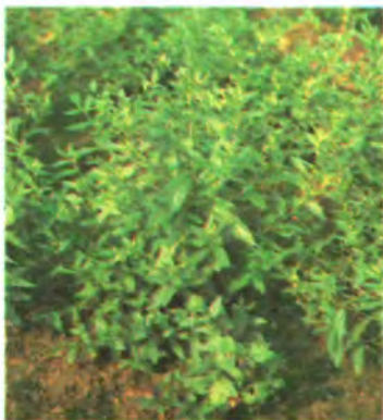
24. Горобейник пурпурово-блакитний.